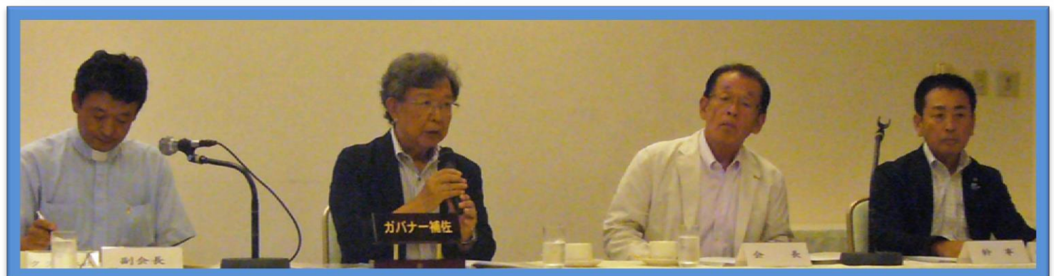
クラブアッセンブリーを開催 舞子ピラ 本館 3階「藤の間」